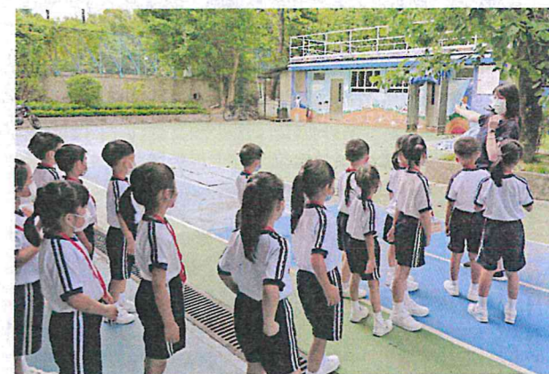
●在老師帶領下熟習校園設施，同時學習排隊守秩序。